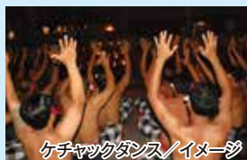
ケチャックダンス/イメージ

ご滞在中は、思い思いにお過ごしいただけるよう、フリータイムを設けております。ホテルでゆったり寛いだり、オプションツアーへ参加したり、夏のリゾートをご満喫ください。