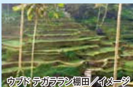
ウブドテガララン棚田/イメージ