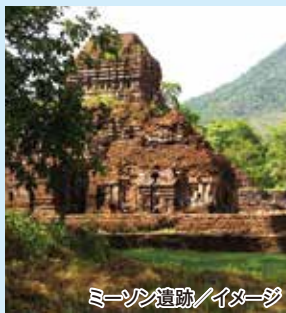
ミーソン遺跡/イメージ

世界遺産3都市をコンパクトにめぐります。ホイアンの美しいランタンに魅了され、ベトナム最後の王朝、阮朝王朝の栄華をフエにて味わいます。最後にインド文化の影響を交易から受けたミーソン遺跡にもご期待ください。