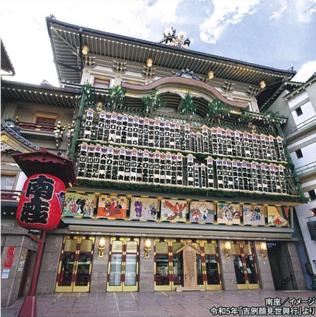
南座/イメージ 令和5年「吉例顔見世興行」より