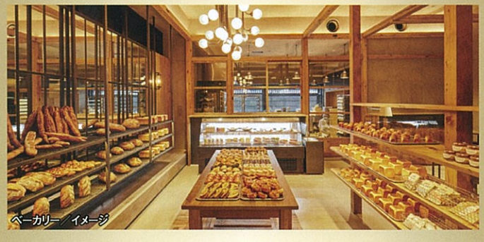
ベーカリー/イメージ