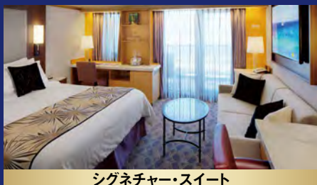
シグネチャー・スイート