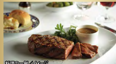
料理の一例/イメージ

— スペシャルティ・ダイニング — 「ピナクルグリル」でのディナー(1回)を無料でご案内します。