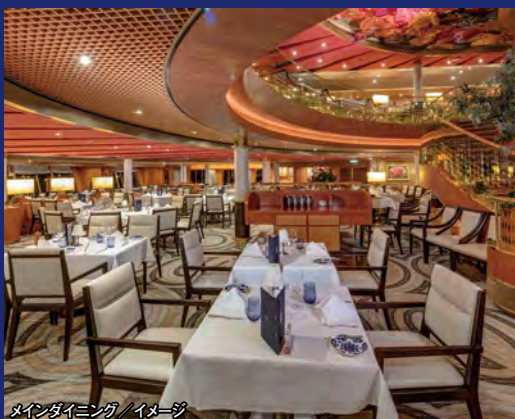
メインダイニング/イメージ

◆船名:ノールダム ◆就航:2006年2月(2019年改装) ◆総トン数:82,318t ◆全長:285.24m ◆全幅:32.21m ◆乗客定員:1,972名 ◆乗務員数:811名 ◆フォーマルナイト:2回