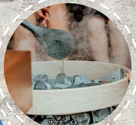
サウナ / イメージ