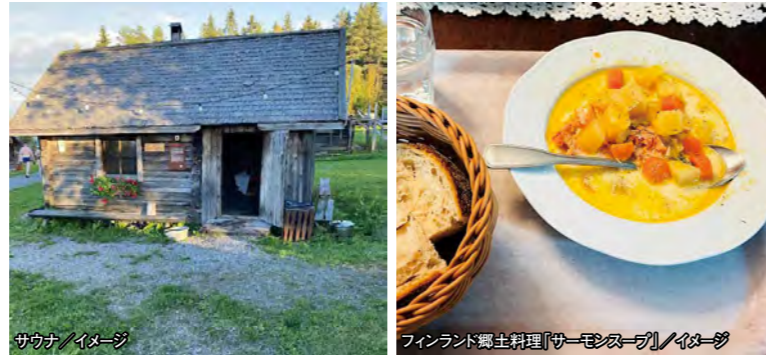
サウナ / イメージ