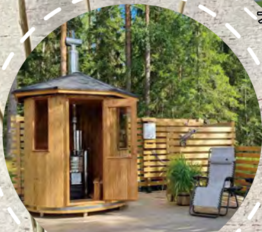
サウナ / イメージ