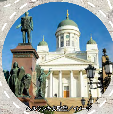
ヘルシンキ大聖堂 / イメージ