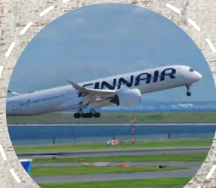
フィンランド航空 / イメージ