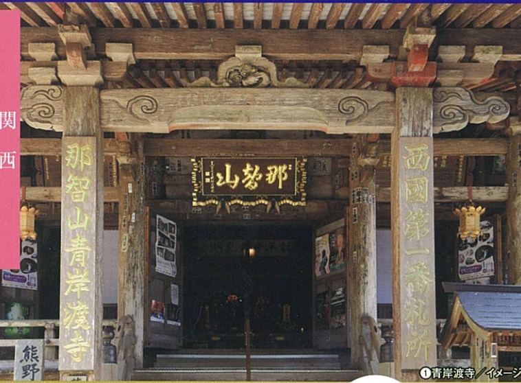
①青岸渡寺 / イメージ