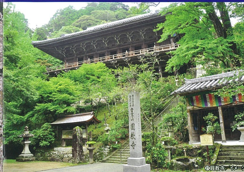
⑦園教寺 / イメージ