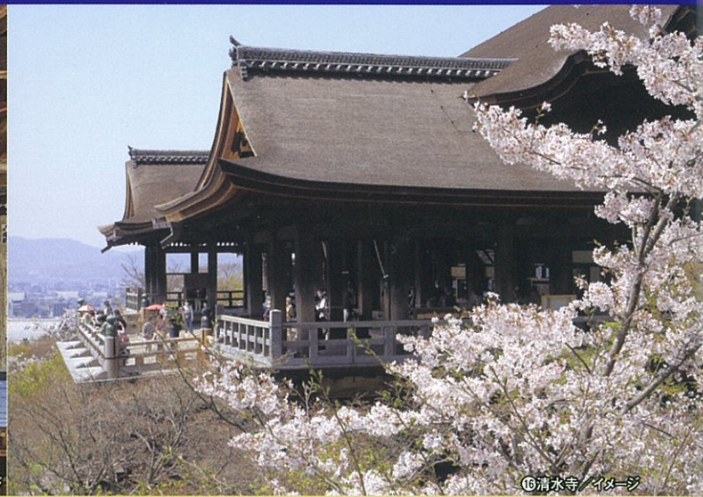
⑩清水寺 / イメージ