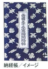
納経帳 / イメージ