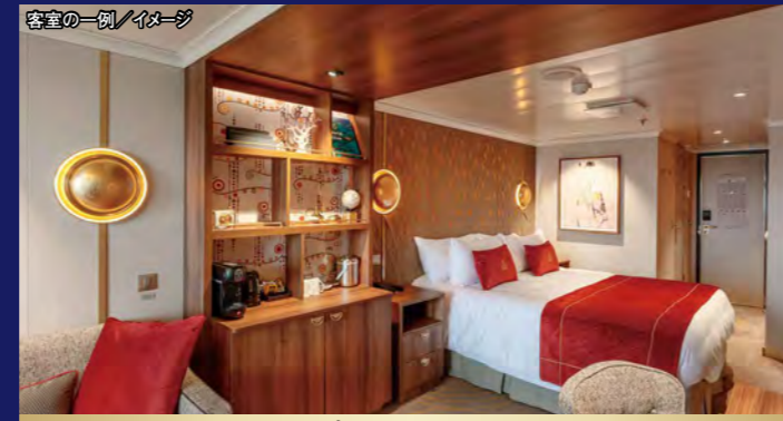
P1/プリンセス スイート