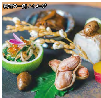
料理の一例／イメージ