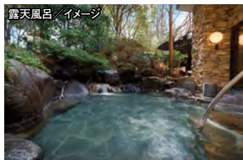
露天風呂／イメージ

●発着地は京都、名古屋、東京よりご選択ください。 ※列車の時間と1日目の食事箇所及び時間は指定させていただきます。 ※今後の情勢によりご利用予定の施設に変更が生じる場合がございます。 ※お食事について：アレルギーによる変更は各施設に申し入れますが、施設により対応が異なり、有料になる場合もございますので予めご了承ください。