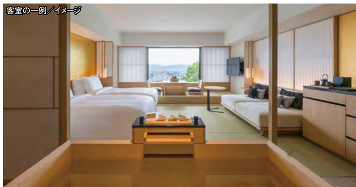
客室の一例／イメージ

●発着地は新大阪、京都、名古屋、東京よりご選択ください。 ※列車の時間と1日目の食事箇所及び時間は指定させていただきます。 ※今後の情勢によりご利用予定の施設に変更が生じる場合がございます。 ※お食事について：アレルギーによる変更は各施設に申し入れますが、施設により対応が異なり、有料になる場合もございますので予めご了承ください。