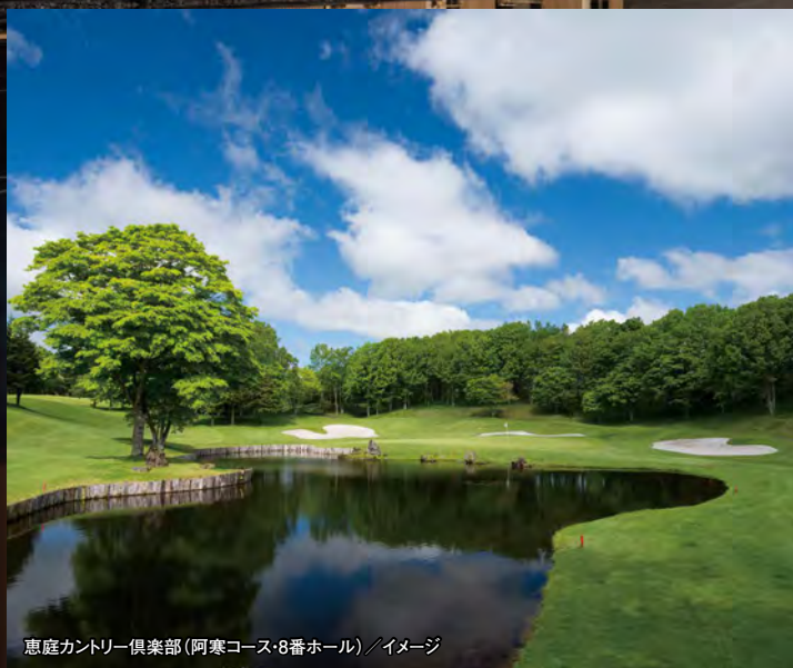
恵庭カントリー倶楽部(阿寒コース・8番ホール)／イメージ