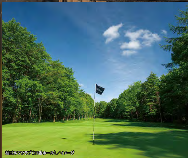
桂ヨルクラブ(11番ホール)／イメージ