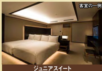
ジュニアスイート

各テーマに基づき独創性の高い質感を特徴としたスイートと使いやすいレイアウトで、よりリラックスした時間をお過ごしいただけるゲストルーム。日本美の要素を豊富に取り込み、心地よい温もりが溢れる空間で一日の疲れをゆっくりと癒していただけます。