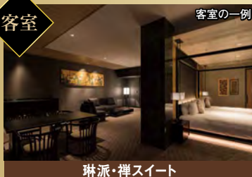
琳派・禅スイート