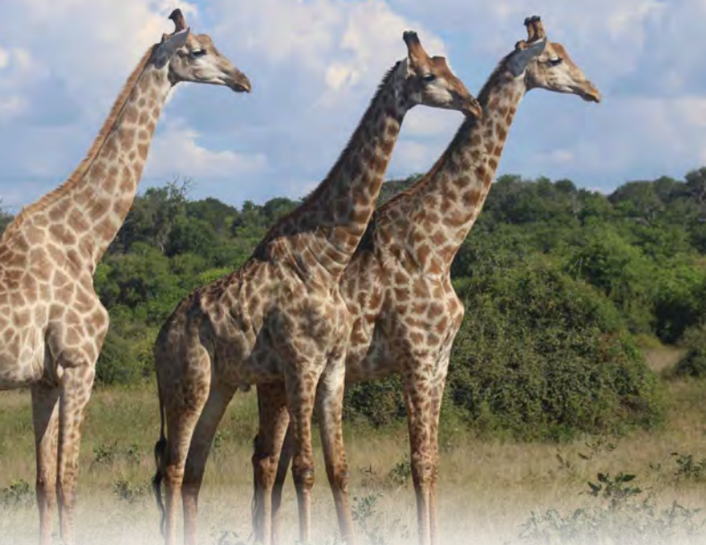
チョベ国立公園/キリン(イメージ)