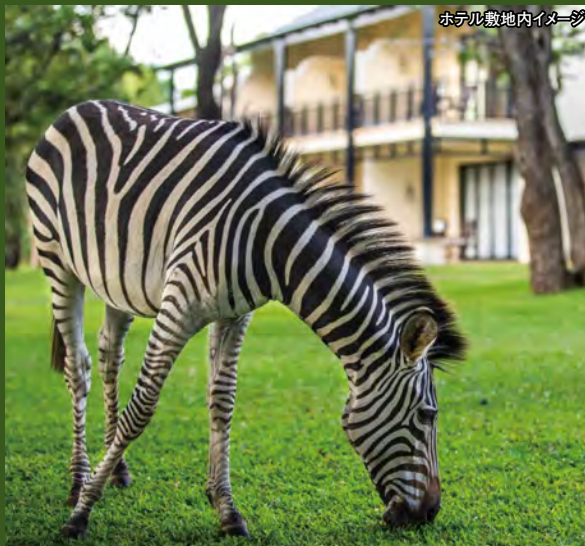
ホテル敷地内イメージ

ヴィクトリアの滝近く、ザンベジ川沿いのモシ・オア・ツンヤ国立公園内に佇む英国式ホテル。レストランでは滝を身近に感じながらお食事を楽しめます。敷地内ではキリンやシマウマの姿を目にすることもできます。