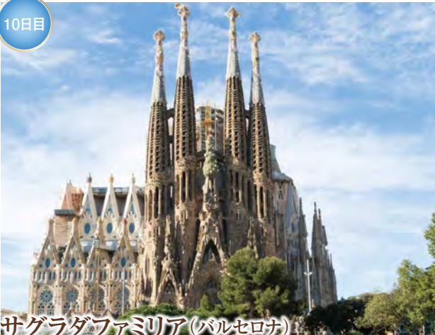
サグラダファミリア(バルセロナ)

世界遺産にも登録されたポルトガル黄金時代を象徴する修道院。精緻な石彫装飾と荘厳な回廊が美しく、ヴァスコ・ダ・ガマの偉業とも深く結びつく歴史的建造物です。