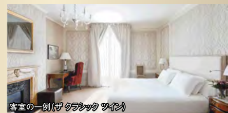
客室の一例(ザ クラシック ツイン)

バルセロナ中心に佇む「エル パレス バルセロナ」は、1919年創業の伝統を誇る格式高い5つ星ホテル。華麗な空間と洗練されたおもてなしで、優雅なご滞在をお楽しみいただけます。