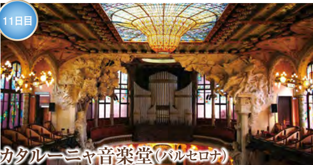
カタルーニャ音楽堂(バルセロナ)

天才建築家ガウディが手がけたバルセロナを象徴する大聖堂。独創的なデザインと光あふれる幻想的な内部空間は多くの人々を魅かし、現在も建設が続く世界的な名作です。