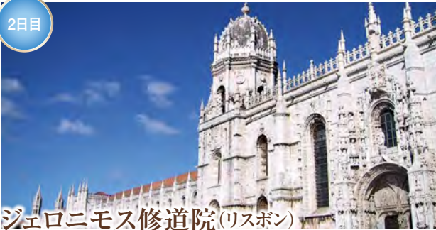
ジェロニモス修道院(リスボン)

世界遺産にも登録されたポルトガル黄金時代を象徴する修道院。精緻な石彫装飾と荘厳な回廊が美しく、ヴァスコ・ダ・ガマの偉業とも深く結びつく歴史的建造物です。